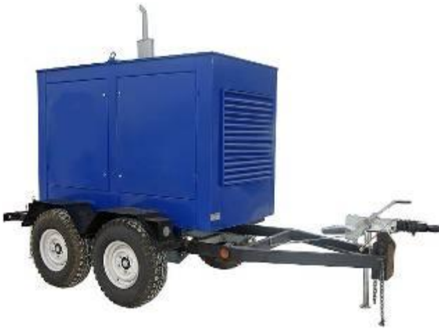
Дизель генератор в погодозащитном капоте на шасси