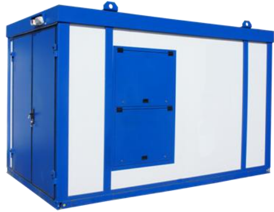
Дизельная электростанция в блок контейнере «Север»

Дизель-генераторные установки в зависимости от условий эксплуатации могут быть выполнены в следующих исполнениях: